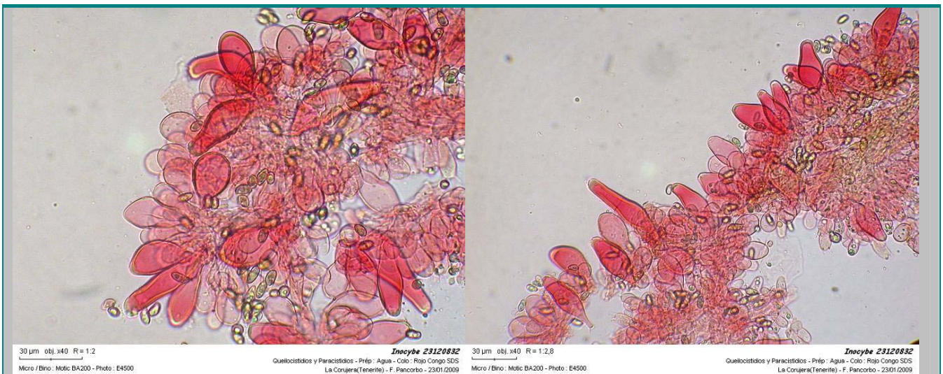
3. Queilocistidios y paracistidios (400x, material seco)