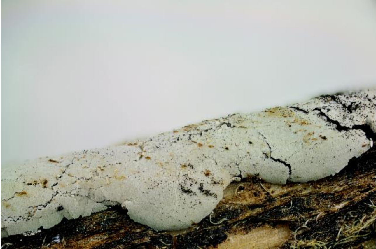
Didymiidae, Stemonitida, Myxogastria, Myxogastrea, Mycetozoa, Amoebozoa, Protozoa