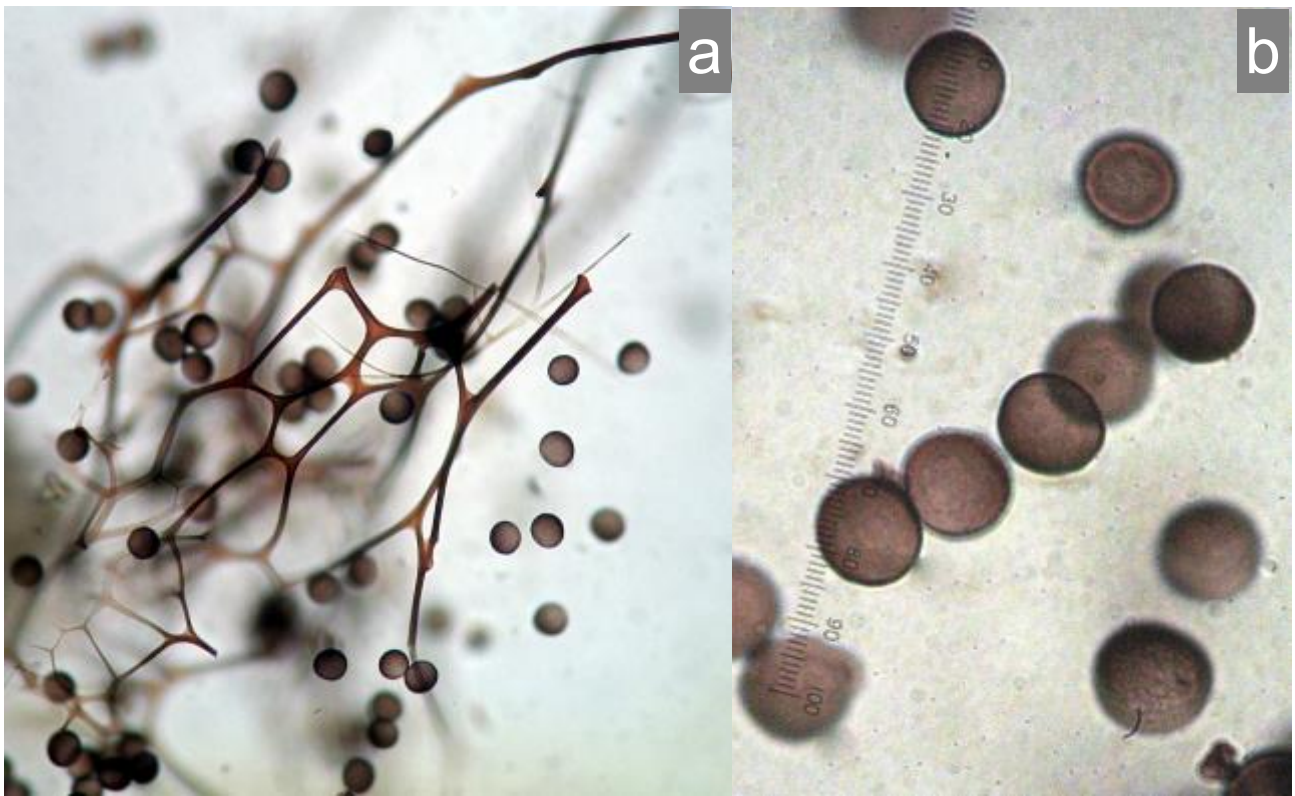
C. Hoyer. a. Esporas e hilos peridiales. Objetivo 40x. b. Esporas. Objetivo 100x.