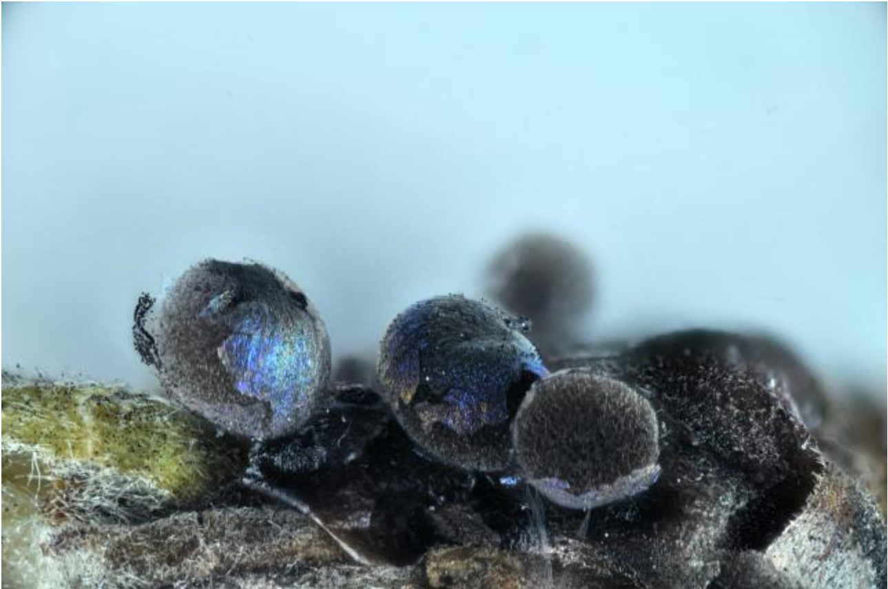
Lamprodermatidae, Stemonitida, Columellinia, Myxogastrea, Mycetozoa, Amoebozoa, Protozoa

(Meyl.) Mar. Mey. & Poulain, in Poulain & Meyer, Bull. Mycol. Bot. Dauphiné-Savoie 45(no. 176): 16 (2005)