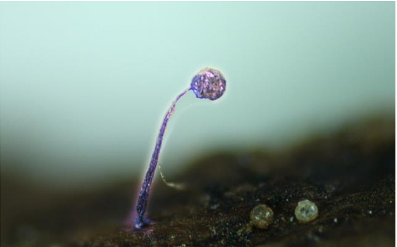
A. Esporocarpio con estípote. Hoyer. Objetivo 100x.