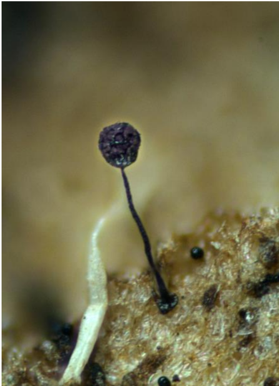
Cribrariidae, Cribrariida, Myxogastria, Myxogastrea, Mycetozoa, Amoebozoa, Protozoa

Meyl., Bull. Soc. Vaud. Sci. Nat. 56 : 326 (1927)