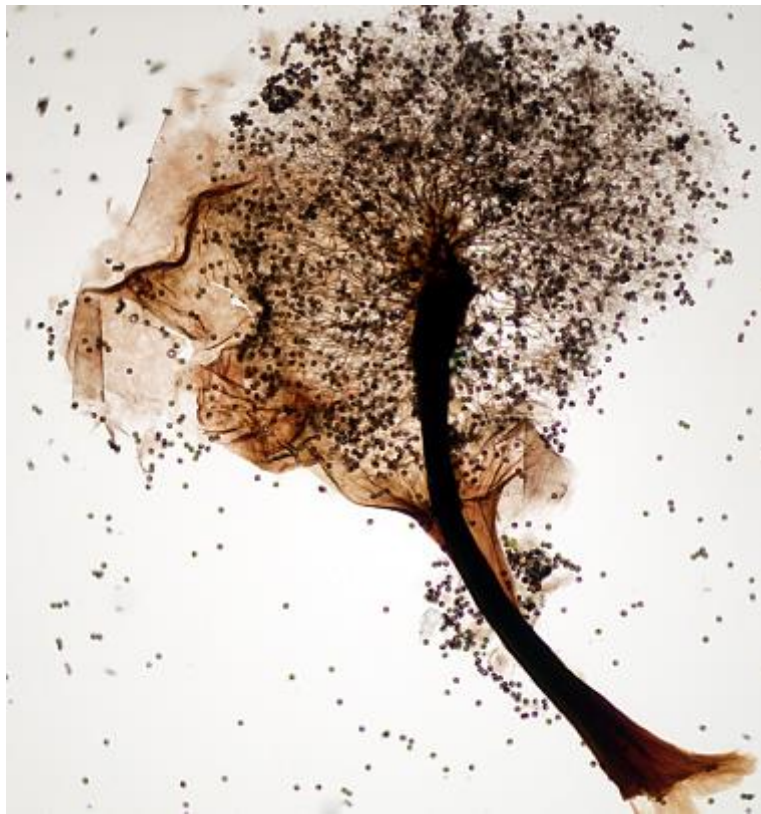
C. Esporoteca y peridio. Hoyer. Objetivo 40x.