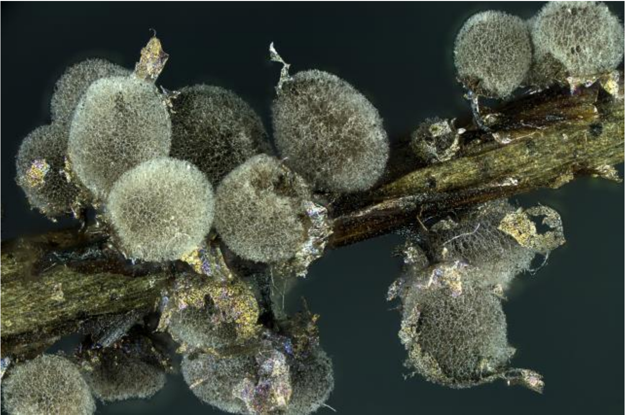
Lamprodermatidae, Stemonitida, Columellinia, Myxogastrea, Mycetozoa, Amoebozoa, Protozoa

Mar. Mey. & Poulain, in Bozonnet, Meyer & Poulain, Docums Mycol. 24(no. 96): 7 (1995)