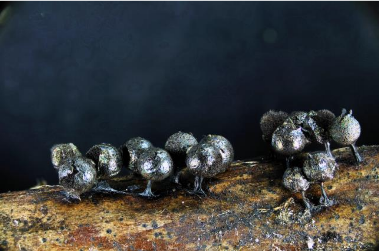
Lamprodermatidae, Stemonitida, Columellinia, Myxogastrea, Mycetozoa, Amoebozoa, Protozoa

Meyl., Bull. Soc. Vaud Sci. Nat. 55 : 240 (1924)