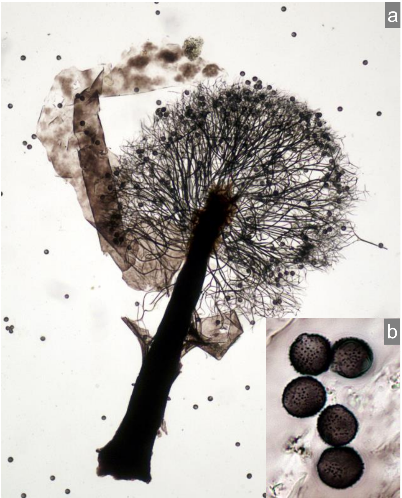
C. Holler. a. Esporoteca. Objetivo 40x. b. Esporas. Objetivo 100x.