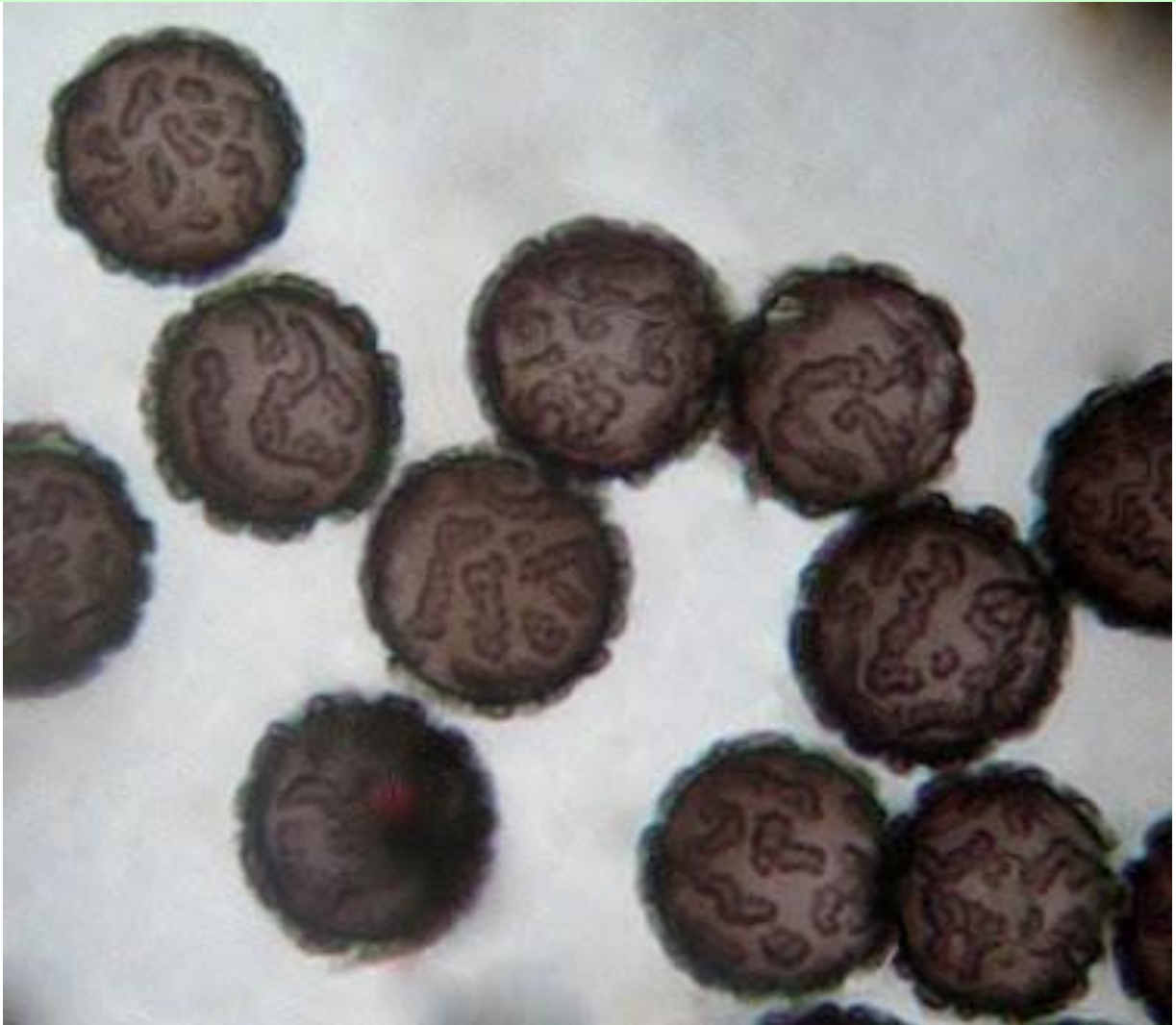
E. Esporas. Hoyer. Objetivo 100x.