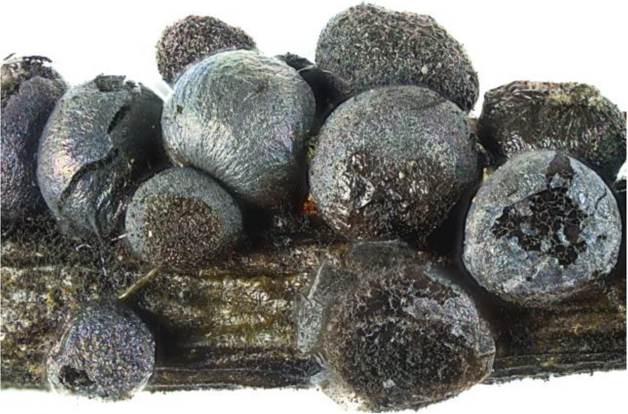
Lamprodermatidae, Stemonitida, Columellinia, Myxogastrea, Mycetozoa, Amoebozoa, Protozoa

Meyl., Bull. Soc. Vaud. Sci. Nat. 53 : 457 (1921) [1920]