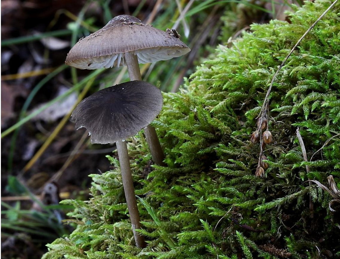
Fig.1. Basidiomas in situ .