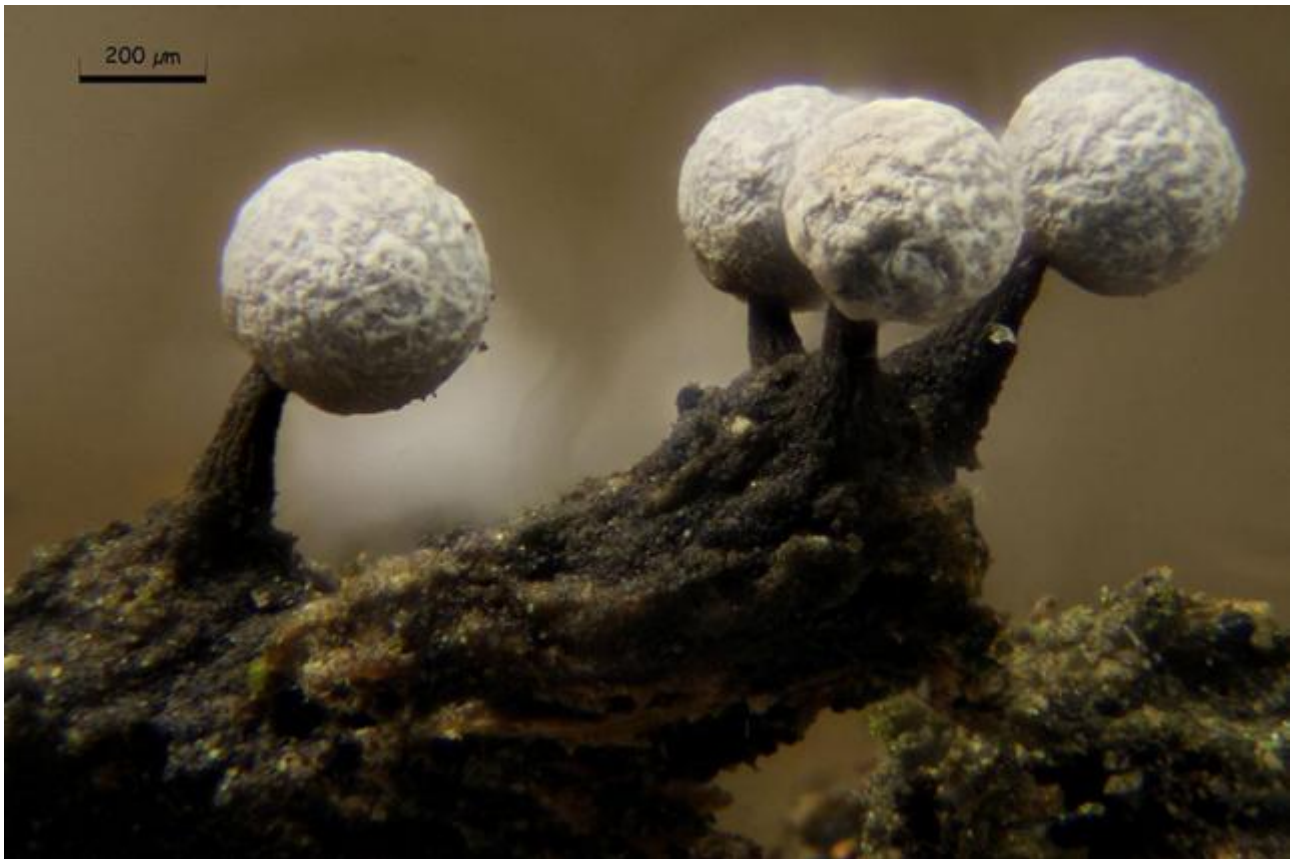
Physaraceae, Physarida, Incertae sedis, Myxogastrea, Mycetozoa, Amoebozoa, Protozoa

Petch, Ann. R. bot. Gdns Peradeniya 4(5): 304 (1909)