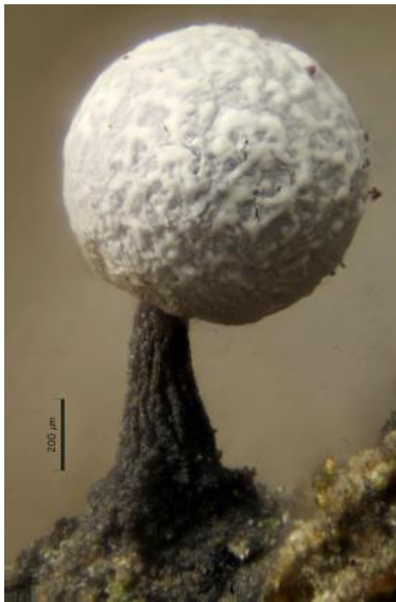
E. Esporocarpo 100x.