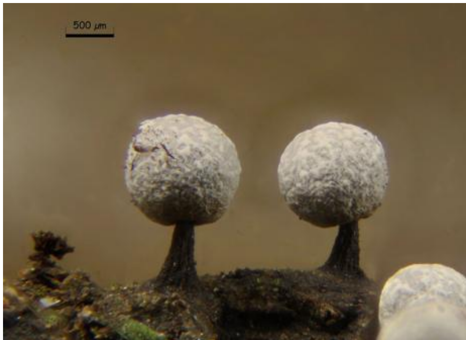
F. Esporocarpos 40x