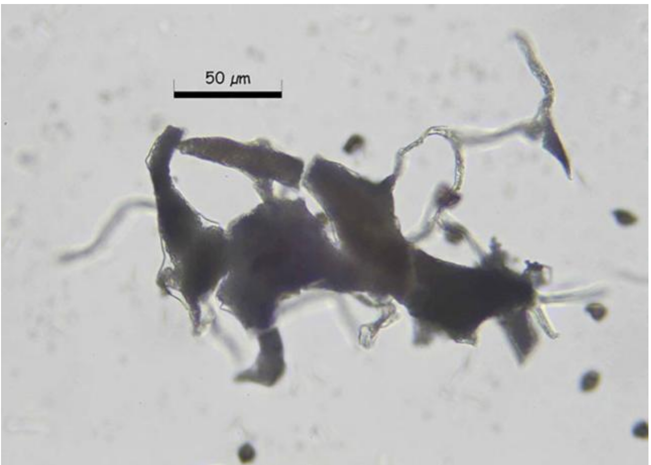
B. Capilicio y nódulos de calcio agua 1000x.