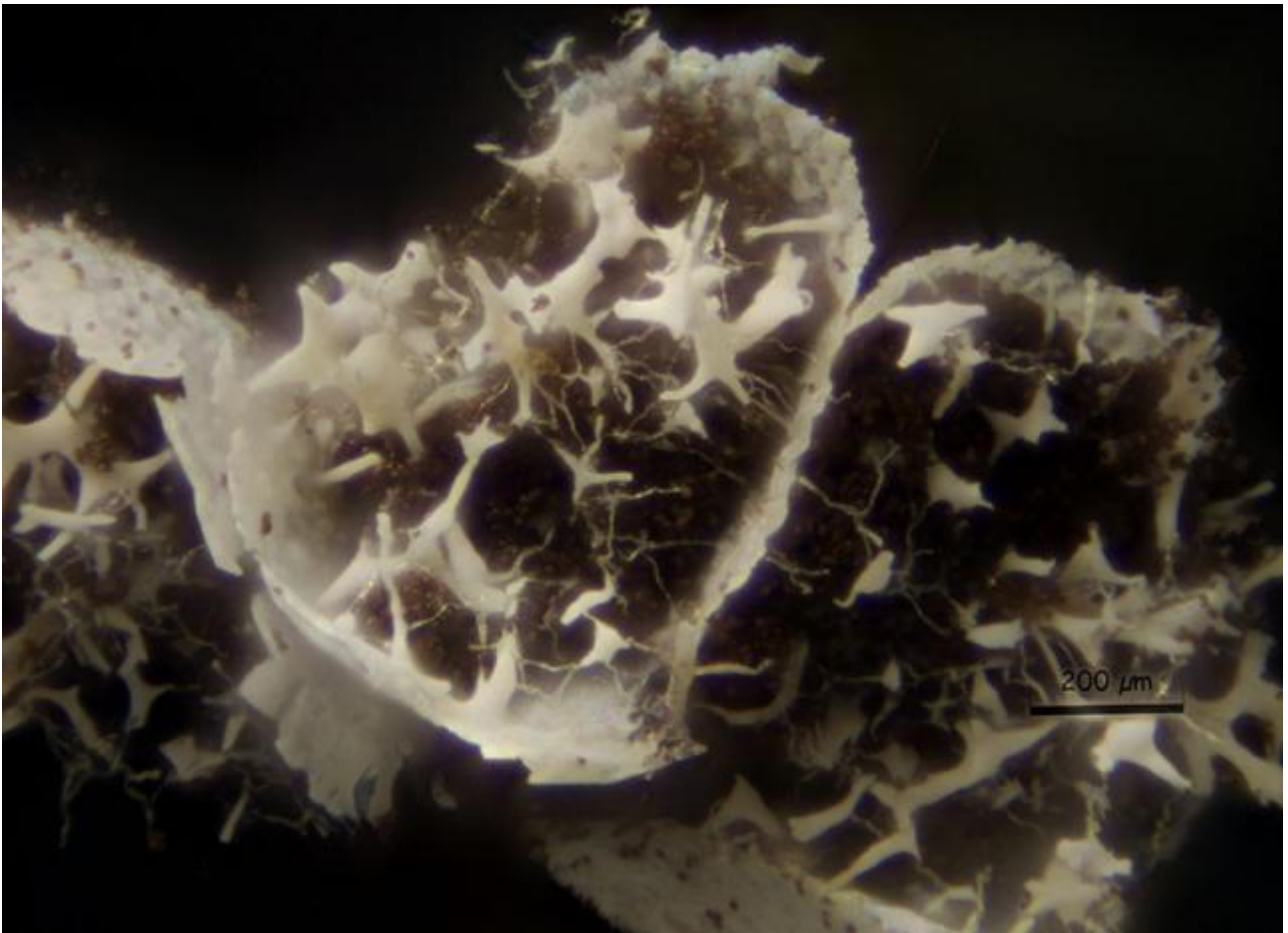
C. Capilicio y peridio 100x.