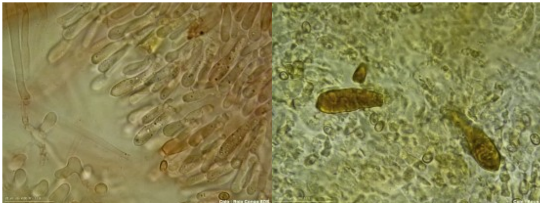
C. Queilocistidios (izquierda) y Pleurocistidios (derecha) en Rojo Congo SDS. 1000x.