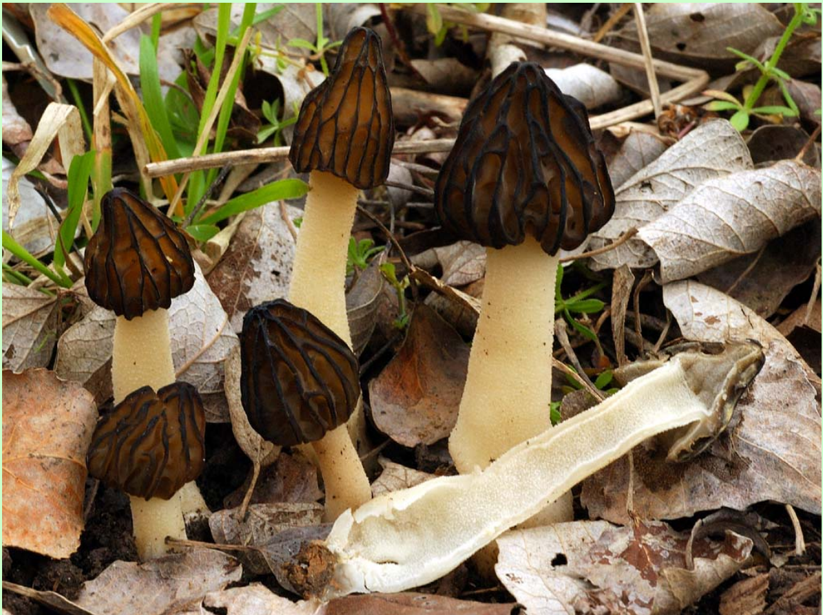
Detalle de la inserción del pie con el sombrero a 2/3 en Mitrophora semilibera