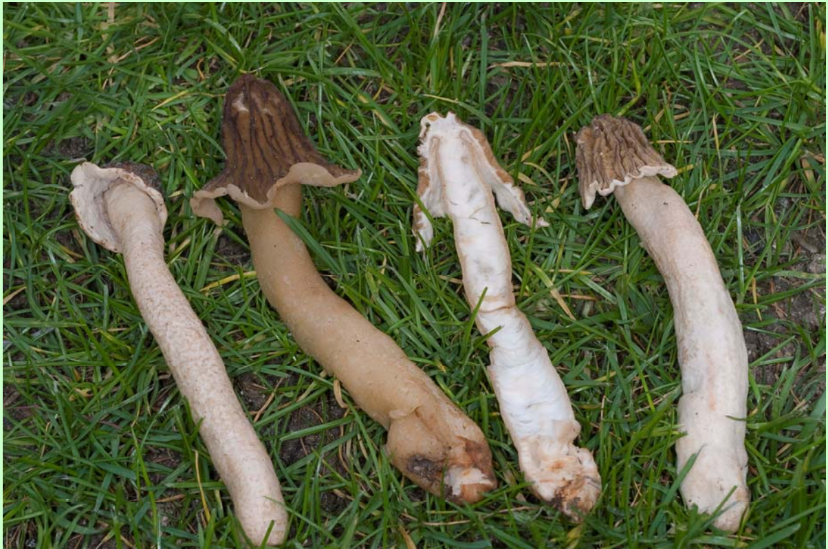
Detalle de la inserción del pie con el sombrero en la parte superior en Verpa bohemica