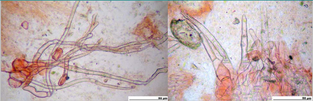
4. Excípulo ectal (200x) de textura angular-globulosa, con pelos hialinos, flexuosos, septados, de paredes gruesas, obtusos, simples o a veces bifurcados de 100- 250 µm.