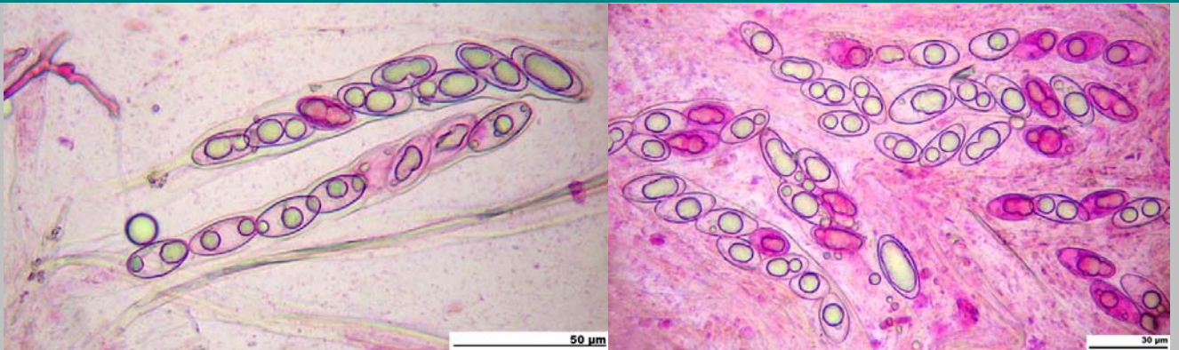
1. Ascas cilíndricas, octospóricas, monoseriadas y con croziers. Ascas con Phloxina B alcohólica (200x) (izquierda). Esporas mono y bigutuladas con Phloxina B alcohólica (200x) (derecha)