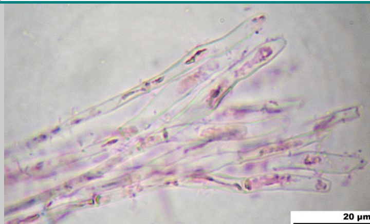
3. Paráfisis (400x)