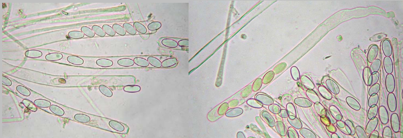
1. Ascas cilíndricas, octospóricas y monoseriadas