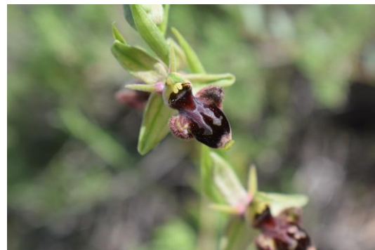
Variabilidad floral en O.x breviappendiculata nsp maimonensis . J. L. Hervás. Comarca de El Condado, Jaén, 2018.