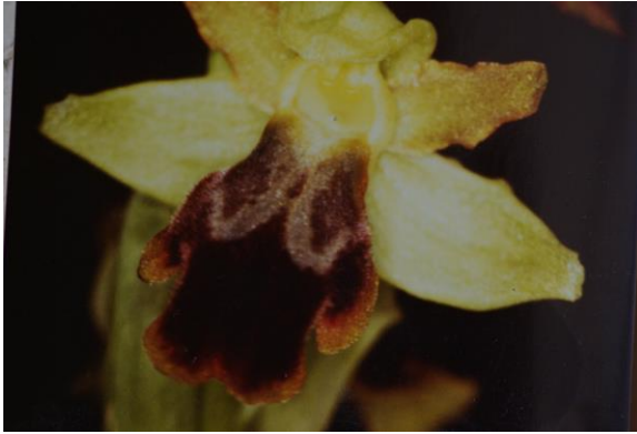
Reproducción de una fotografía que adscribimos a O. x gauthieri nsp fraresiana . P. Bouillie. Sierra de Cazorla, Jaén, 1986