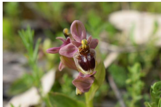
O. x sommieri nsp humbertii . J.L. Hervás. Linares, Jaén, 2017.