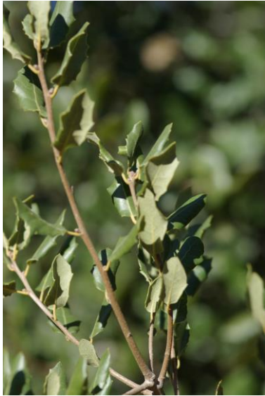
Quercus x morisii