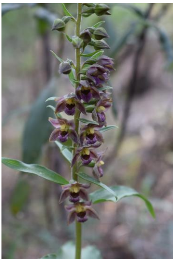
Epipactis helleborine tremolsii