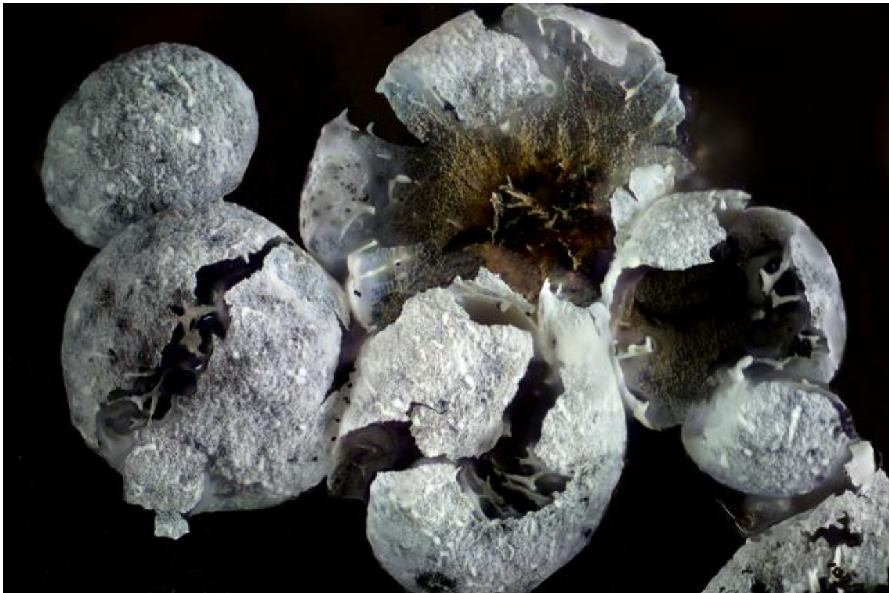
Physaridae, Physarida, Columellinia, Myxogastrea, Mycetozoa, Amoebozoa, Protozoa

Meyl., Bull. Soc. Vaud. Sci. Nat. 56: 66 (1925)