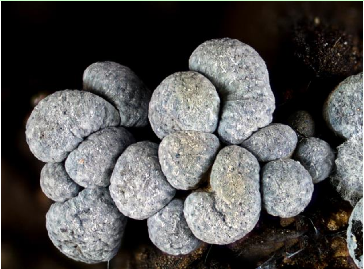
D. Esporocarpos. Hoyer.