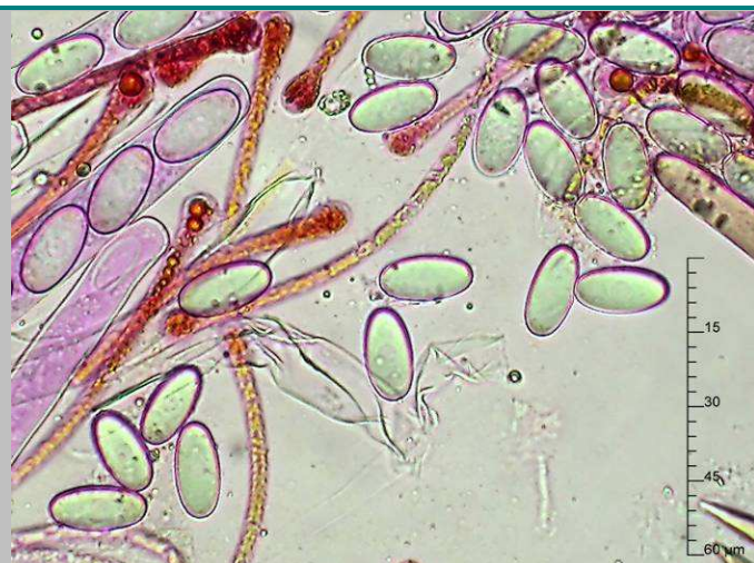
1. Esporas X400

Medida de esporas 18,6 [19,7 ; 20,1] 21,3 x 9 [9,8 ; 10,1] 10,8 \mu\text{m} Q = 1,8 [1,97 ; 2,04] 2,2 ; N = 40 ; C = 95% Me = 19,93 x 9,95 \mu\text{m} ; Qe = 2,01