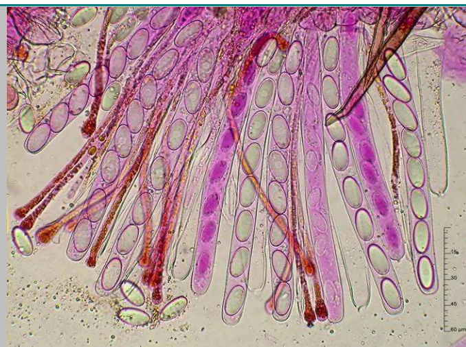
2. Ascas y paráfisis X400

Medida de esporas FP08032002 17,2 [19 ; 19,8] 21,6 x 8,8 [9,7 ; 10] 10,9 \mu\text{m} Q = 1,8 [1,9 ; 2] 2,1 ; N = 36 ; C = 95% Me = 19,4 x 9,85 ; Qe = 1,97