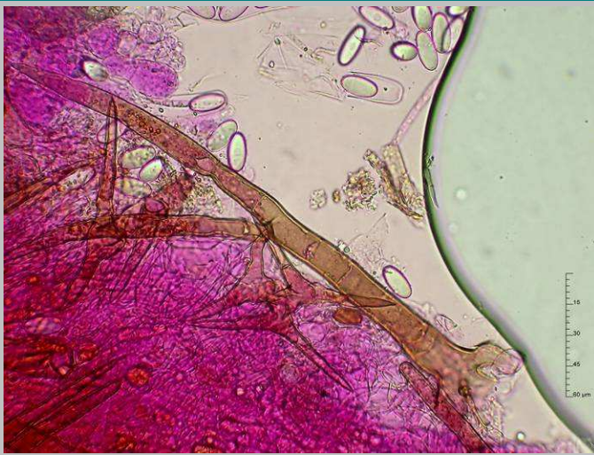
3. Pelos marginales X400