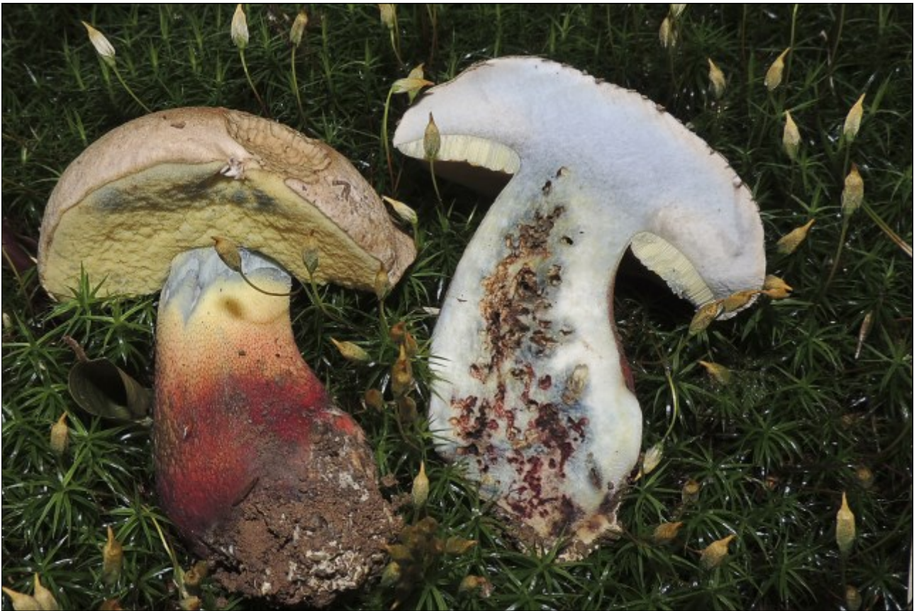
Boletaceae, Boletales, Agaricomycetidae, Agaricomycetes, Agaricomycotina, Basidiomycota, Fungi

(Pers.) Vizzini, Index Fungorum 146: 1 (2014)