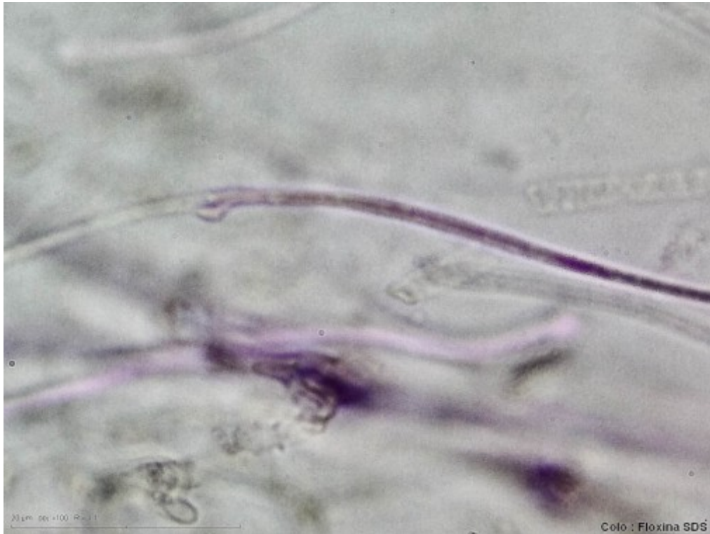
C. Presencia de fibulas Floxina SDS. 1000x