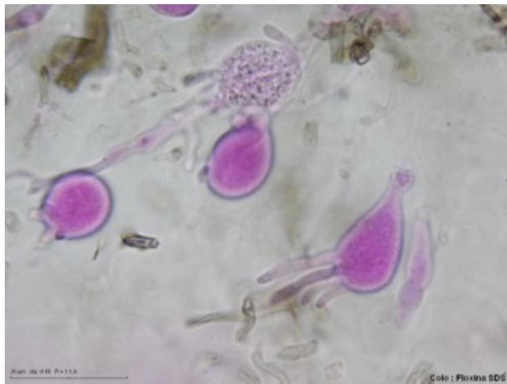
A. Basidios en Floxina SDS. 1000x